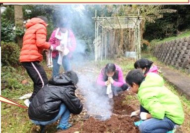
待つ間、草取りも頑張りました。