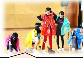
良い子の味方、東っ子レンジャー参上！