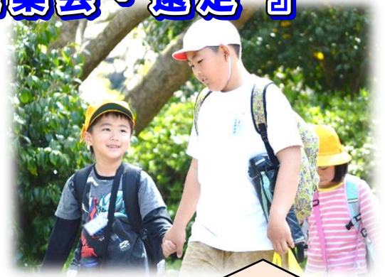
6年生を見つめる眼差しがいいですね。