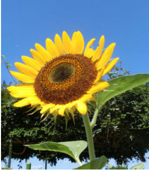
【ひまわり花言葉：憧れ】

歴史に残る酷暑・炎暑の暑さにも、突然の台風による激しい風雨にも負けず、葉をいっぱいに広げた校庭のひまわりの花は、その名のとおり、太陽に向かって凛とした姿を見せてくれています。その姿は、「2学期もがんばるぞ！」と強い決意で新学期を迎えた北っ子たちの姿そのものです。