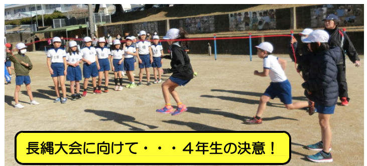
長縄大会に向けて・・・4年生の決意！

今年の「新年の抱負」発表会は、インフルエンザ流行を防ぐため、全校児童が一堂に集まることを避け、「校内放送」による発表としました。発表は、各学年代表児童によるものでしたが、北っ子230名、どの子も強い決意をもって、新たな希望の一年を迎えています。ご家庭でもお子様の決意を聞いていただき、励ましていただければ幸いです。