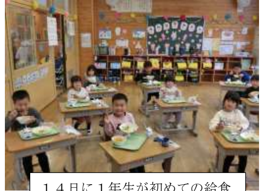
14日に1年生が初めての給食

15日(金)に今年度初めの授業参観を行いました。子供たちは緊張しながらも、保護者の方の顔を見て喜んだり、はりきって発表したりする姿が見られました。新学期がスタートして1週間余り経ちますが、まだ緊張や不安もあることと思います。お子様の様子で気になることは担任に御相談ください。保護者の皆様と連携を図りながら、子供たちが楽しく学べる環境づくりに努めてまいります。また、15日は、昼にPTA総会、夜はPTA理事会も行いました。今年度のPTAの活動が、子供たちの活動を支える組織として、皆様の御理解と御協力のもと進められることを願っています。〇〇会長様をはじめ、皆様にはお世話をおかけいたしますが、どうぞよろしくお願いいたします。